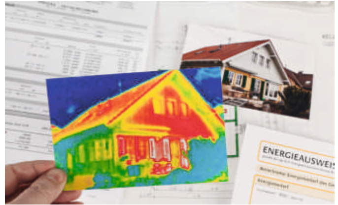
Abb 5, Wärmebild einer Fassade

Nasse Wände geben bedingt durch die gute Leitfähigkeit von Wasser auch einen Großteil der für die Wohnräume aufgewendeten Heizenergie über die Fassade nach außen ab. Eine trockene Fassade isoliert besser als eine feuchte Fassade, ähnlich wie ein „nasser Pullover“. Thermografische Untersuchungen an Fassaden ergaben, dass bereits bei ca. 10% Wandfeuchte bis zu 25% an Wärmedämmung verloren geht! Durch eine Imprägnierung mit HP-F Pro nimmt das Mauerwerk kein Regenwasser mehr auf, die Mauerwerksporen bleiben mit Luft gefüllt und es kann so eine Energieeinsparung von bis zu 25% und mehr erreicht werden.