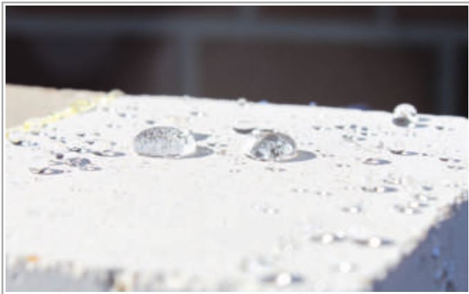
Abb. 4, Lotuseffekt nach der Imprägnierung

Ein Großteil der in den Innenräumen vorhandenen Wohnfeuchte wird nicht nur durch regelmäßiges Lüften, sondern auch durch Diffusion des Wasserdampfes von innen nach außen durch das Mauerwerk abgegeben. Eine nasse Fassade zieht daher auch immer einen eingeschränkten Wassertransport der Wohnfeuchte nach sich. Diese Feuchte schlägt sich in der Folge auf den Wänden nieder (kondensiert) und bildet so, gemeinsam z.B. mit vorhandener Tapete, die Lebensgrundlage für Schimmelpilze. Mit einer HP-F Pro Fassadenimprägnierung bleibt die Fassade selbst im Regen trocken, dem Schimmel wird das Wasser als Lebensgrundlage entzogen.