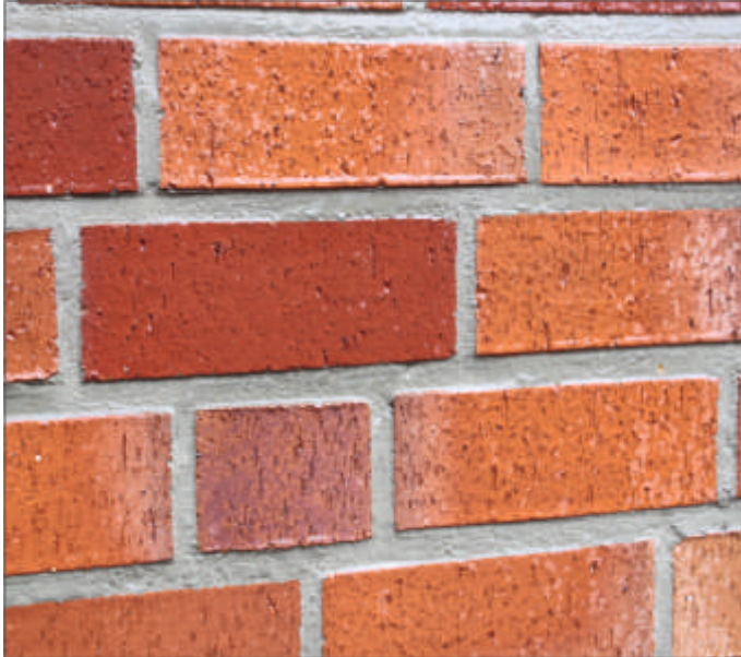
Abb.1, Unbehandelte Fassade. Wasser wird vom Baustoff aufgenommen.

HP-F Pro ist ein dauerhafter, nicht sichtbarer Schutzauftrag auf Fassaden, der gegen Verschmutzung und Durchfeuchtung wirksam ist.