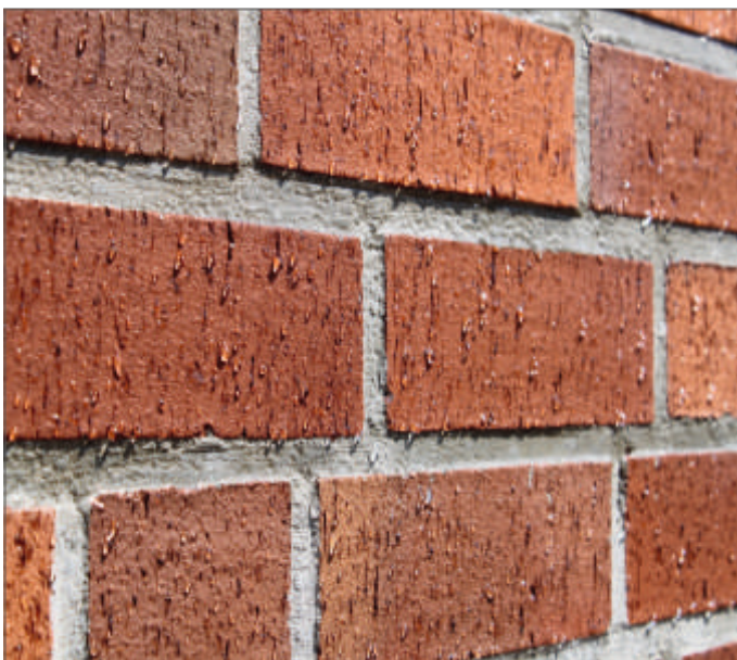
Abb.2, Imprägnierte Fassade. Wasser perlt ab und der Baustoff ist trocken.

Durch die wasserabweisende Wirkung des Produkts nimmt die Fassade kein Regenwasser auf. Auch Kalkausblühungen, Algen- und Moosbefall sowie Frostschäden werden verhindert.